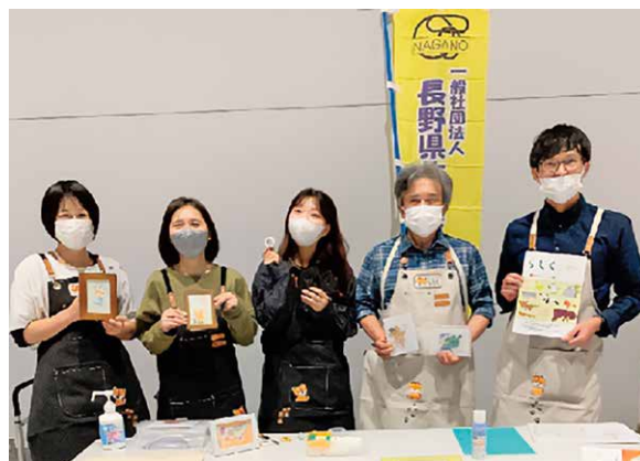
一般社団法人 長野県作業療法士会