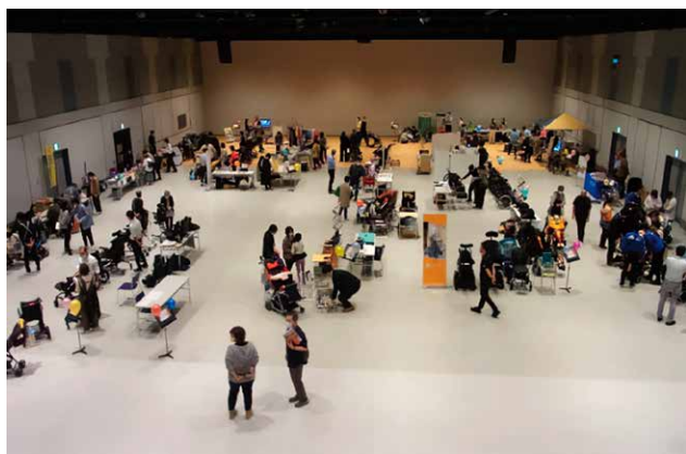
当日の会場の様子