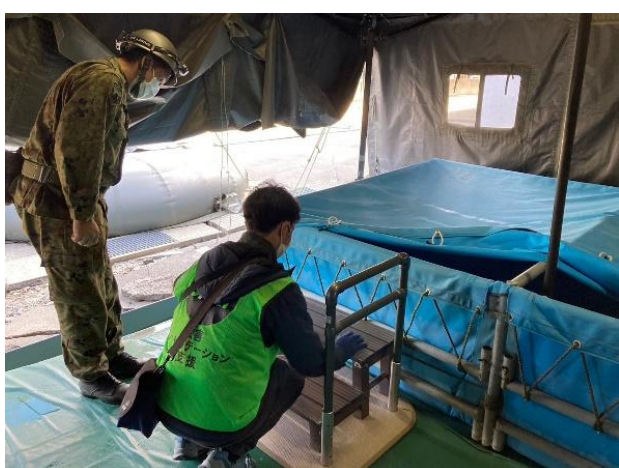
写真⑤（浴室に手すりを設置する様子）