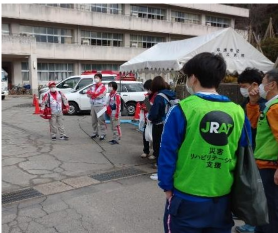
写真⑨（他チームと連携して避難所へ訪問）