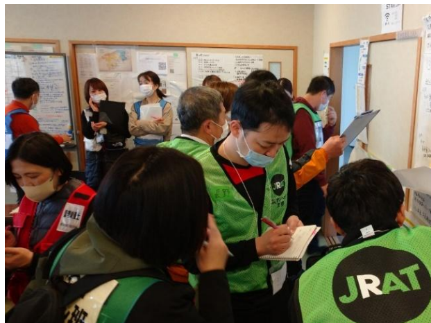
写真⑧（会議後の保健師チームとの調整）