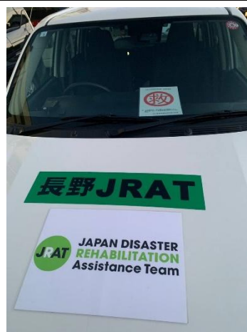
写真④（JRAT および長野 JRAT ステッカー）