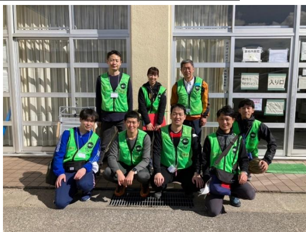
写真⑫（第1隊メンバー）