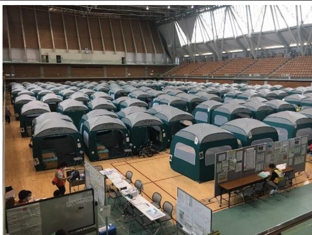
写真⑪（1.5次避難所の様子）