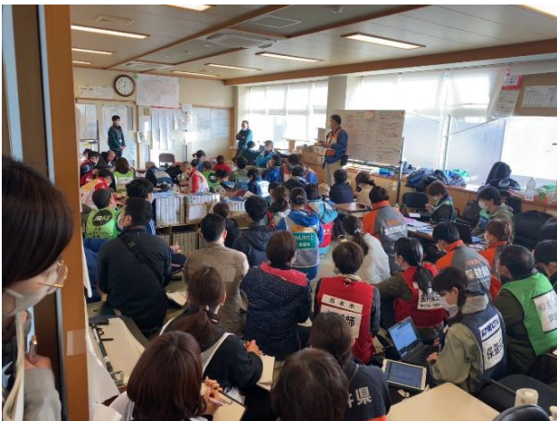
写真⑦（朝の保健医療調整本部会議）