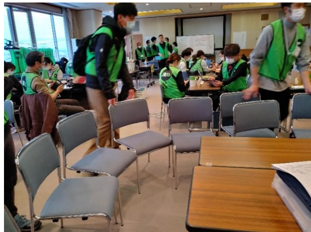
写真②（石川 JRAT 本部でのオリエンテーション）