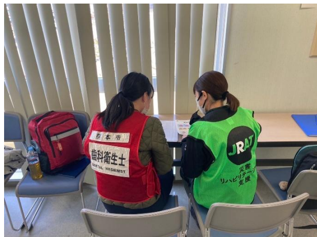
写真⑩（STと歯科衛生士の連携）