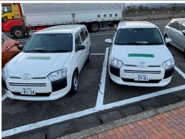
写真③（現地の移動に使用したレンタカー）