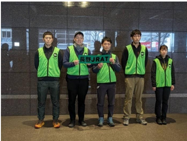
写真① （出発式の様子）