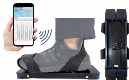
図 下駄型荷重測定器 GET'A ®

当院ではこれまで動作観察に頼らざるを得なかった動作時の荷重量測定を GET'A ® を用いて可視化することで新しい理学療法展開が可能となった。今後も更なる研究により ADL 動作の安全性や予後予測の検討に役立つ評価指標を模索して行きたい。